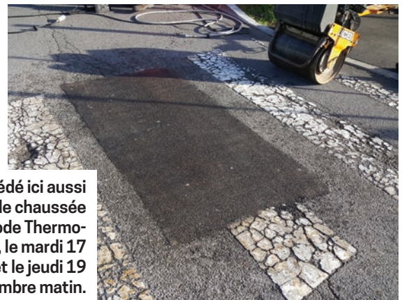
③ La société NEOVIA a procédé ici aussi à des réparations d'enrobé de chaussée avec la même méthode Thermo-réparation rue Cassiopée, le mardi 17 novembre après-midi et le jeudi 19 novembre matin.