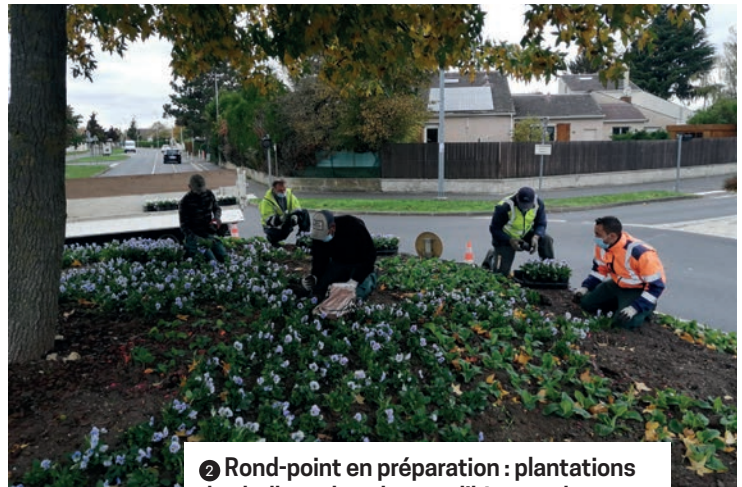
② Rond-point en préparation : plantations des bulbes, des plantes d'hiver et des fleurs telles que les traditionnelles pensées pour apporter couleurs et douceur en cette saison hivernale.