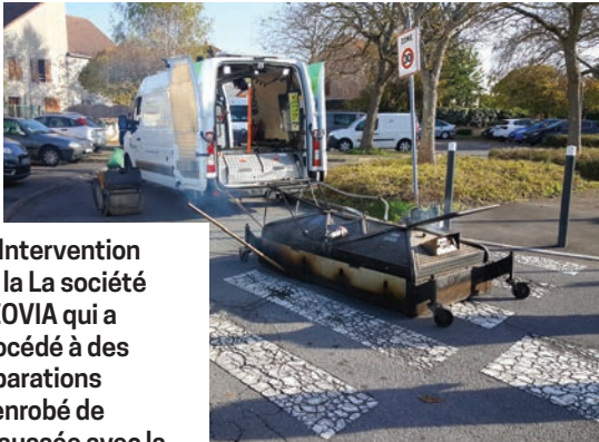
① Intervention de la La société NEOVIA qui a procédé à des réparations d'enrobé de chaussée avec la méthode Thermo-réparation, rue Hector Berlioz le 12 novembre 2020.