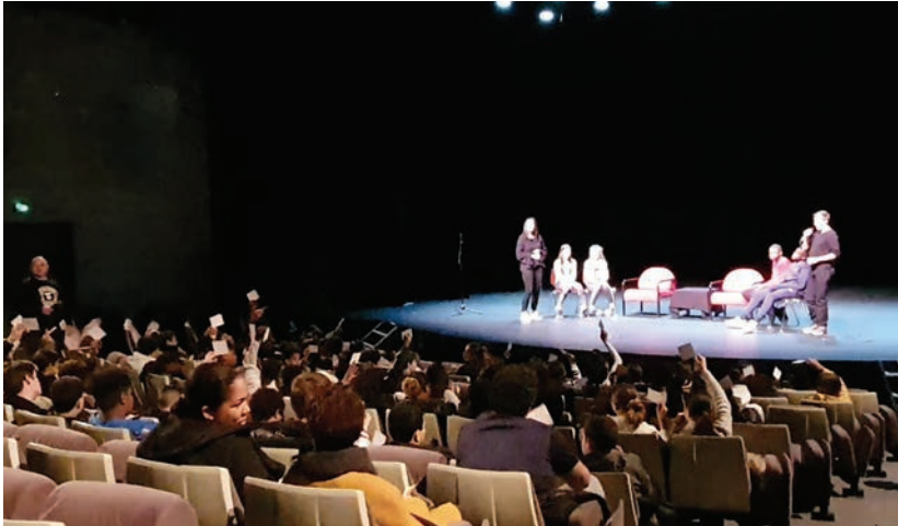
→ Interactivité, débats, le théâtre forum de la compagnie Ogoa favorise les échanges et la compréhension de l'Autre.