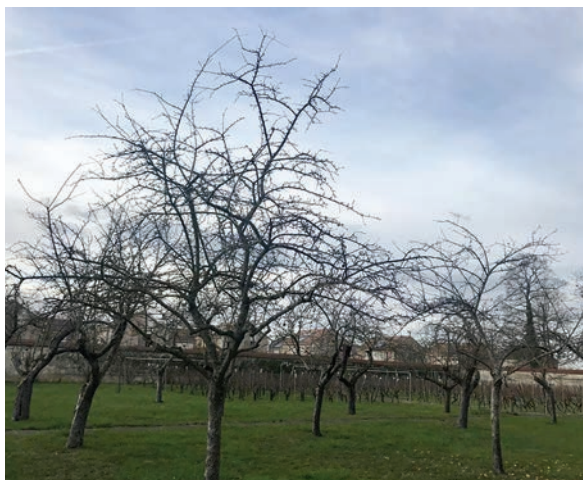
↓ Le verger du Parc Chaussy

Il s'inscrit dans une démarche de valorisation et d'axes d'amélioration de la cuisine centrale sur les quatre thèmes suivants : Bien être, assiette responsable, éco-gestes, engagement social et territorial.