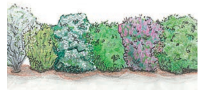
Exemple d'une haie mélangée

Si vous souhaitez planter une haie, choisissez donc de préférence des essences locales d'arbustes, le mieux étant avec le label Végétal local (et Vraies messicoles pour les herbacées). Vous pouvez vous renseigner sur les listes réalisées par Seine-et-Marne Environnement et l'Agence Régionale de la Biodiversité d'Île-de-France via leurs sites internet. Vous y trouverez par exemple la bourdaine, le cornouiller sanguin, le fusain d'Europe ou encore le houx commun pour ne citer qu'eux. Privilégier ces espèces en mélanges, permettra de nourrir tout un cortège d'animaux (oiseaux, insectes) et sur toute l'année, ce que ne font pas