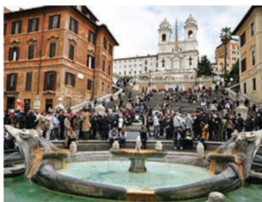
↑ La fontaine Barcaccia au centre de la Place d'Espagne de Rome

L e Risorgimento se situe dans la seconde moitié du XIX ème siècle au terme de laquelle les rois de la Maison de Savoie unifient la péninsule italienne. « D'expression géographique », l'Italie devient une réalité politique le 17 mai 1861 par la proclamation du royaume d'Italie, puis par l'annexion le 20 septembre 1870 de la ville de Rome, alors capitale de l'État de l'Eglise, qui se proclame capitale d'Italie. Le pape se réfugie au Vatican. La « question romaine » se termine en 1929 avec les Accords de Latran qui reconnaissent l'Etat du Vatican. En 1946 la monarchie est abolie pour laisser place à une république votée par référendum.