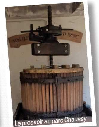
Le pressoir au parc Chaussy