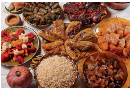
Un repas de Noël bulgare

jadis Noël le 7 janvier, comme tous les pays de l'Est. En 1967, l'Eglise bulgare abandonna le calendrier Julien au profit du calendrier Grégorien et dans les années 90, le retour des libertés citoyennes démocratiques, dont celle de la pratique du culte et des fêtes religieuses, permit au jour de Noël de devenir populaire le 25 décembre. Il ne faut pas négliger la pression du marketing, ni oublier que l'image du Père Noël telle que nous la connaissons a été inventée par Coca Cola.