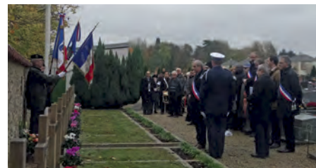
Lors de la Cérémonie du 11 novembre

Marché de dupes, de surcroît, pour nos concitoyens, qui verront pour certains d'entre eux la Taxe d'habitation s'effacer en 4 ans alors que l'augmentation de 1,7 point de CSG, elle, n'attendra pas ce délai pour s'appliquer puisque dès le 1er janvier prochain elle frappera tous les revenus, à commencer par ceux de nos anciens qui, percevant une pension de retraite de plus de 1200 euros par mois, ont été déclarés « aisés » par nos gouvernants