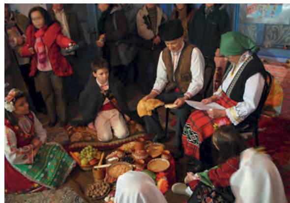
Tradition dans un village

Le réveillon du 24 décembre se prépare tout au long de la journée, avec en premier la confection du pain rituel rond et décoré de symboles de prospérité et d'abondance, puis l'élaboration de 7 à 12 plats tous végétariens, selon la tradition. Dans la cheminée ou dans le poêle, une