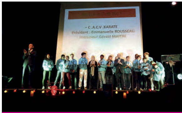
Le karaté élu meilleur club de l'année !

Cette année, le gala des sports s'est déroulé à la salle des Fête André Malraux. Au cours de la manifestation, 20 associations ont été représentées et 290 sportives, sportifs et dirigeants bénévoles ont été récompensés.