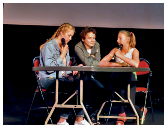
Les élèves de 3 ème du collège les Cités Unies lors de la présentation de la scénette.

Tout au long de l'année, le projet au col-