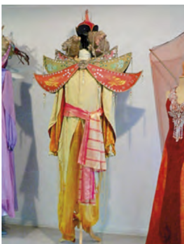
Les voyages de Gulliver Le roi de Laputa

L'exposition se déroule du 13 septembre au 8 octobre 2017 du mercredi au dimanche de 14h à 18h. Vernissage le 13 septembre à 18h.