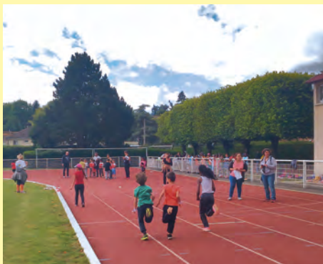
Course des écoles de la ville début juin au parc des sports Alain Mimoun.