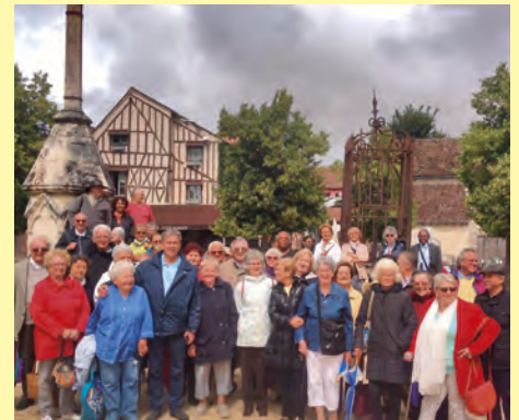
Pour les seniors, journée dans la cité médiévale de Provins avec la pluie au rendez-vous qui n'a pourtant pas gâché cette belle journée.