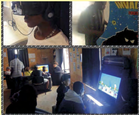
Un Festiv' Jeunes e-sport a été organisé le 13 juillet avec tournois, retrogaming, arcades... Une Lud'Ados a été organisée au service Jeunesse fin juillet, permettant aux jeunes de se retrouver pour jouer ensemble.