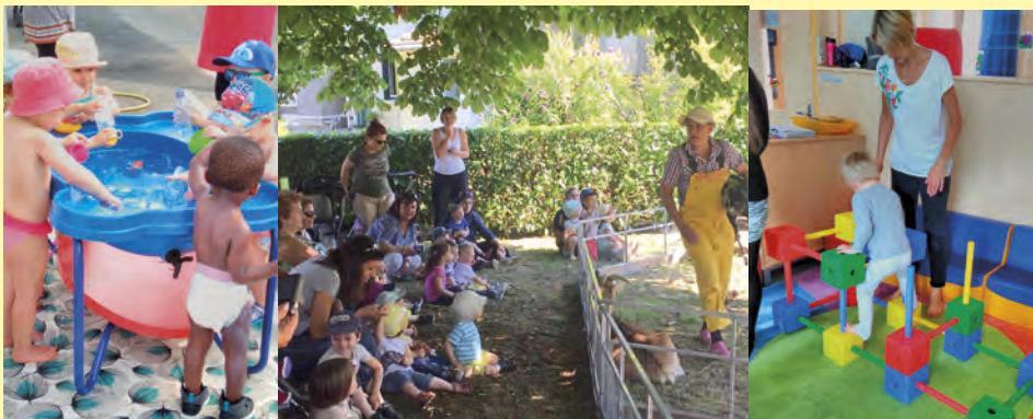
Les activités du RAM : ateliers d'éveil en juin et en juillet, intervention d'une psychomotricienne au Centre de loisirs Beausoleil et jeux d'eau pendant la période de vacance scolaire de juillet et surtout pendant la canicule. Les enfants du RAM ont également visité la ferme Tiligolo.