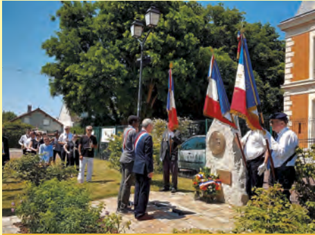
Commemoration du 18 juin.