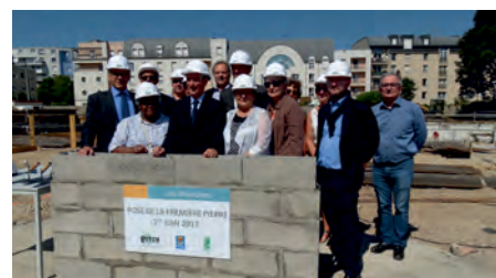
Pose de la première pierre des Brandons le 1er juin 2017

Inquiétude car, loin d'avoir tout réglé du simple coup de la baguette magique qui accompagnerait son élection, le nouveau pouvoir a clairement annoncé durant l'été que le tour de vis à l'encontre des collectivités locales allait non seulement être maintenu, mais – plus grave ! – être amplifié. Une fois de plus, après plusieurs années de scandaleuse réduction des dotations de l'État aux collectivités, le gouvernement nous annonce que les communes, pourtant bien plus sérieuses dans leur gestion que l'État lui-même, vont devoir encore se serrer la ceinture, alors qu'il ne reste plus rien depuis longtemps du prétendu « gras » qu'elles auraient mis de côté !