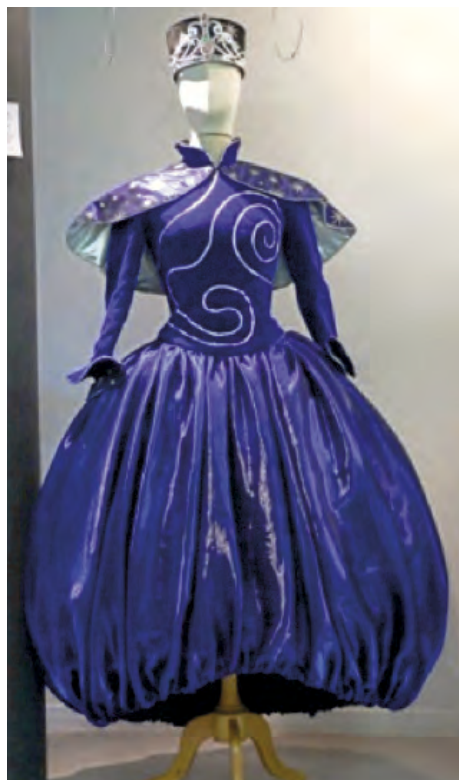
Ubu Roi - costume de la Reine

Pour la première exposition de la saison 2017-2018, le Château de la Fresnaye, accueille une exposition « Le Jeu de l'Histoire et de la Fable » présentée par l'association Tabarmukk, qui propose de vous faire rêver à travers la littérature et les costumes des plus grands personnages.