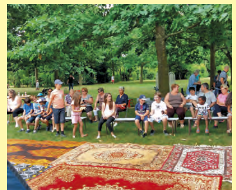
Fin juin les habitants du conseil de quartier gare ont organisé leur pique-nique avec théâtre et jeux divers.