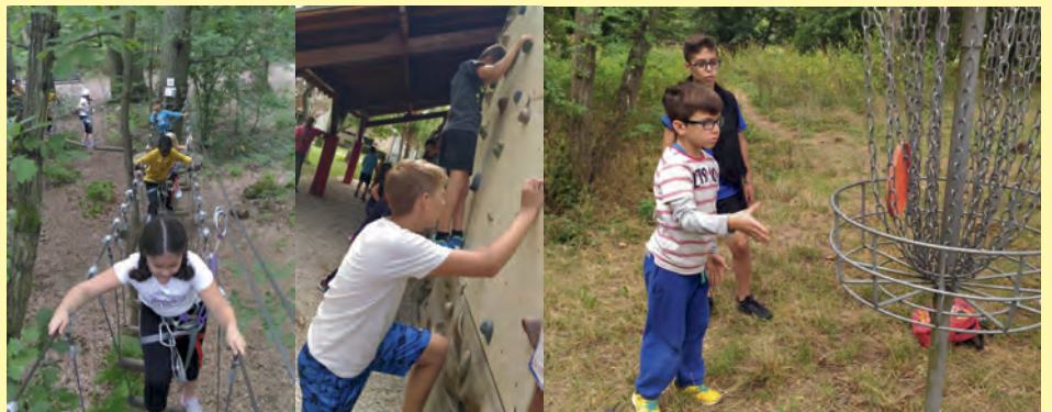
Les stages sportifs organisés par l'Ecole Municipale des Sports en juillet ont conduit 32 enfants à l'accrobranche puis 22 autres sur la base de plein air de Bois le Roi pour faire de l'escalade et du disc golf. De quoi bien se dépenser avant la rentrée.