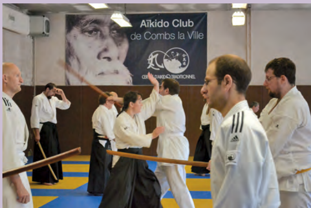
Les adultes à l'entraînement

L'aïkido est un art martial japonais (budo), fondé par Morihei Ueshiba O sensei entre 1925 et 1960. L'aïkido se