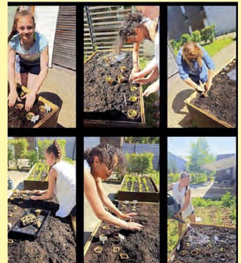
Projet Jardin'âge à l'EHPAD. Plantation des semis avec les jeunes de l'Elan 11-14 ans.