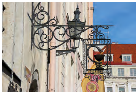
L'enseigne d'une pharmacie

Ce pays balte est membre de l'Union Européenne depuis 2004 et de la zone euro depuis 2011. Il compte 1,3 millions d'habitants et préside depuis juillet 2017 le Conseil de l'Union européenne. Il a su gagner son indépendance en 1991 et sortir du bloc soviétique sans répression, contrairement à ses deux voisins, la Lettonie et la Lituanie. À la tête de cette République parlementaire, une présidente de 47 ans, Kersti Kaljulaid, est la première femme à accéder à cette haute fonction, et aussi la plus jeune.