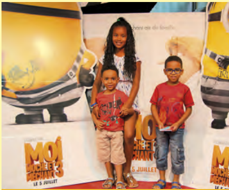
150 personnes ont participé au Ciné goûter autour du film «Moi, moche et méchant» le 11 juillet.