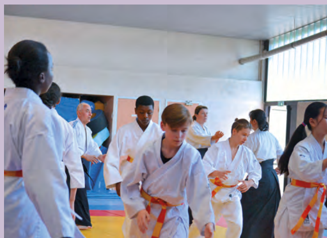
Stage d'aïkido enfants avec les ceintures noires

Vous pouvez aussi consulter notre site : www.aikidoclubcombslaville.fr ou nous joindre par téléphone au 01.64.88.42.46