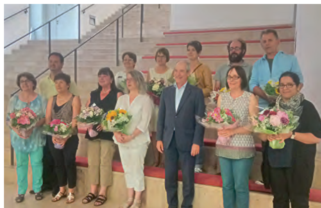
Départ des enseignants

Rendez-vous sur le site de la ville www.combs-la-ville.fr !