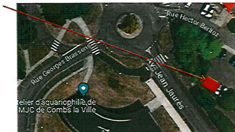
Emplacement de la Station – 2 places