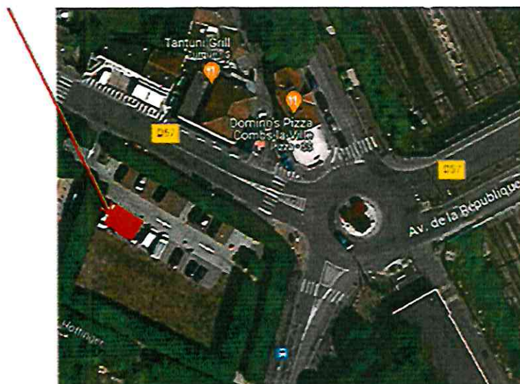
Emplacement de la Station – 2 places