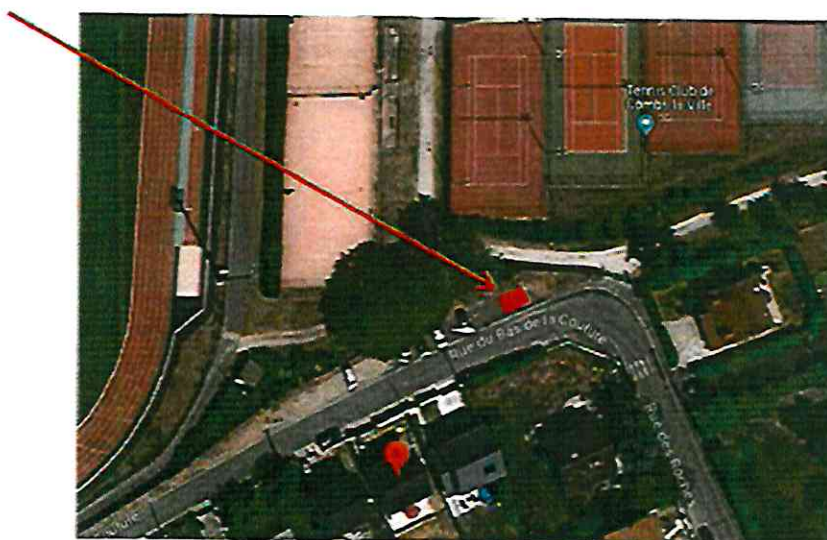
Emplacement de la Station – 2 places