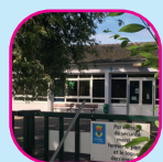
Animation RAM à Beausoleil Place Hottinger

Le Ram est géré par la ville de Combs-la-Ville avec le soutien de la Caf 77.