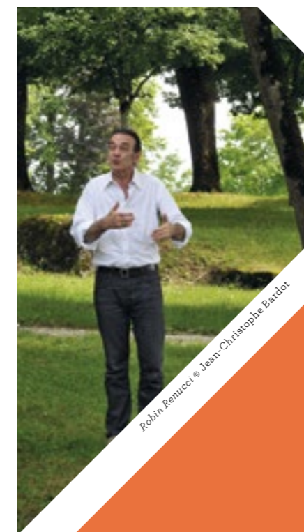
Robin Renucci

PUBLIC : À PARTIR DE 15 ANS DURÉE : 50 MINUTES (suivi d'une rencontre avec le public)