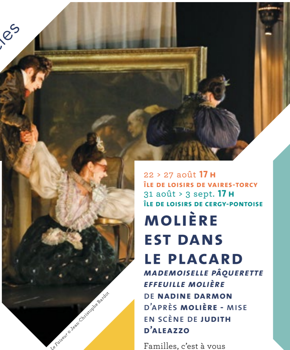
Le Faiseur

PUBLIC : À PARTIR DE 13 ANS DURÉE : 2 HEURES