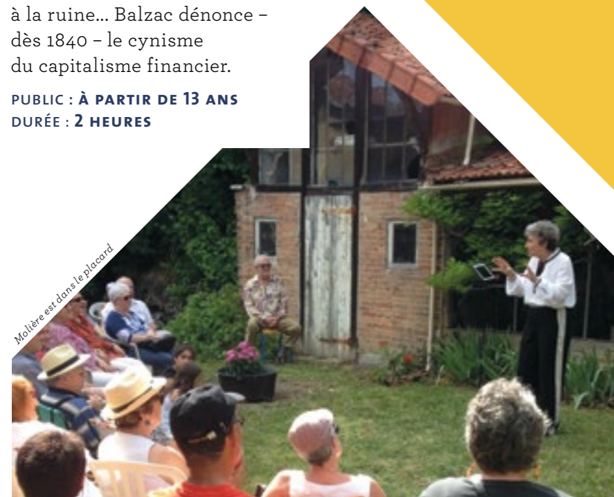
Molière est dans le placard

PUBLIC : À PARTIR DE 13 ANS DURÉE : 1 HEURE